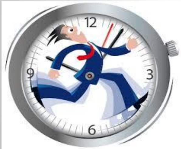
הארפת זמן (30 שניות)