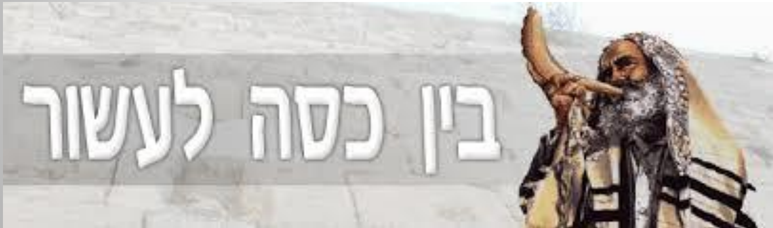
מיכל אור- גרופר