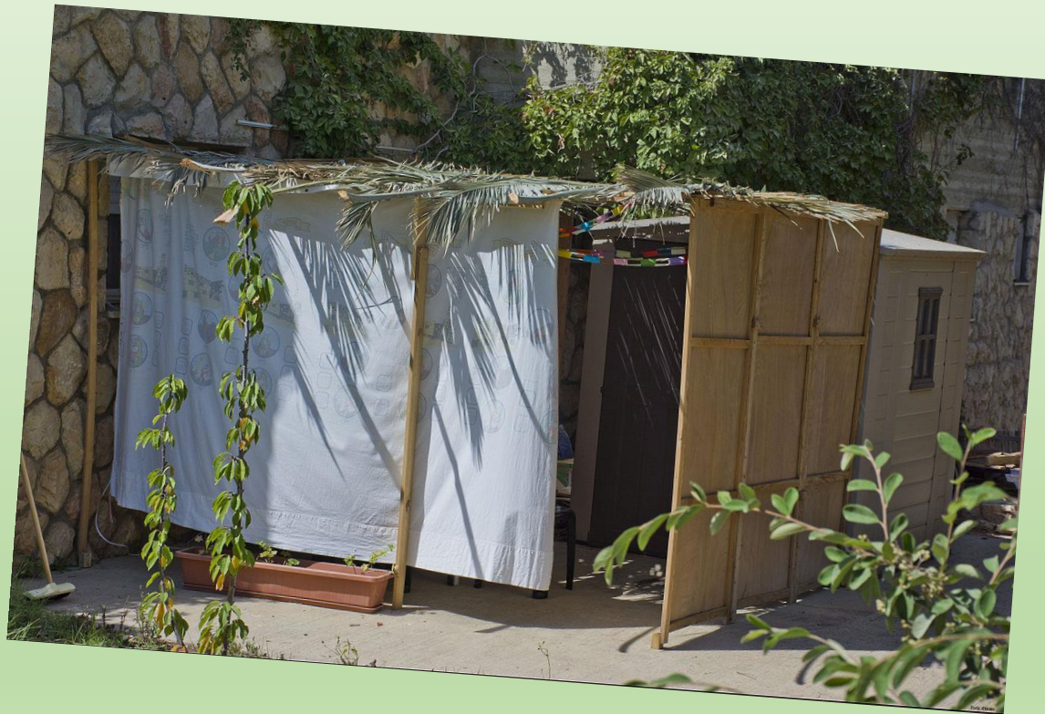
מיכל אור- גרופר