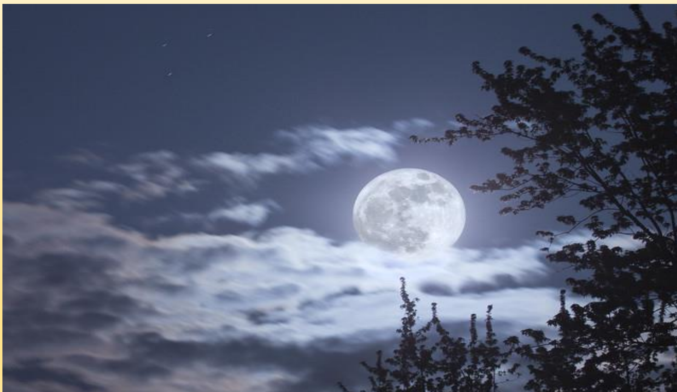
מיכל אור- גרופר