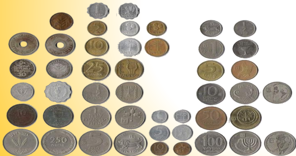
מיכל אור- גרופר